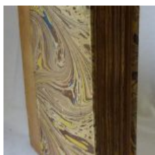
Nous les chiens, par Paul ACHARD