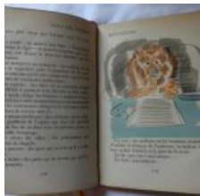
Nous les chiens, par Paul ACHARD