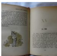
Nous les chiens, par Paul ACHARD