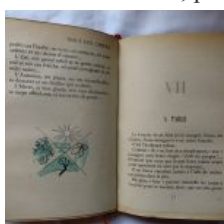
Nous les chiens, par Paul ACHARD